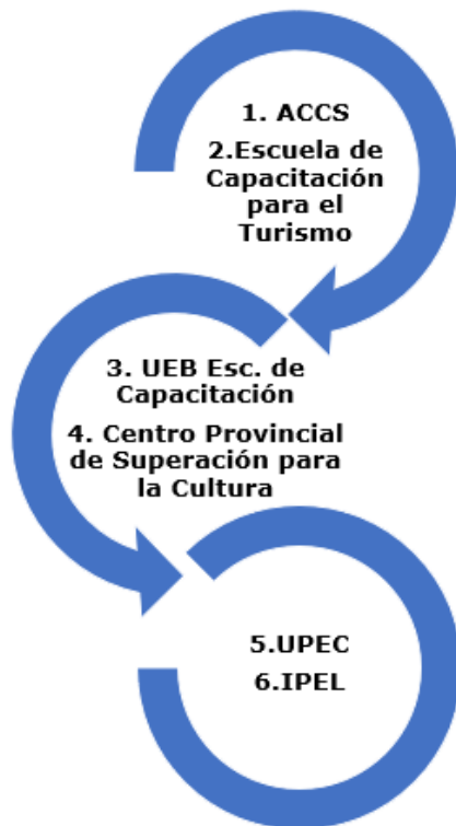
Figura 2. Centros ubicados por número, siendo el 1 el más representativo.