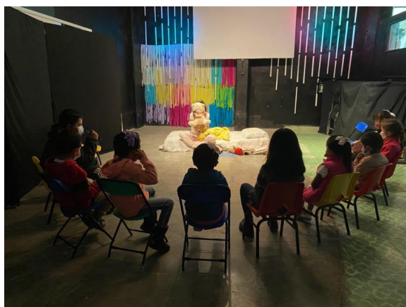
Figura 4. Narración oral en educación cristiana, 2022.

Fue a principios de este año que se reanudaron paulatinamente las actividades en la iglesia, pero el proceso fue complicado. El departamento de educación cristiana fue uno de los que sufrió estragos en su retorno al espacio áulico. Algunos padres de familia tenían temor de enviar a sus hijos a las clases y los niños que sí asistían reflejaban ansiedad y temor. Aunque el protocolo sanitario se llevaba a cabo con cautela, los niños expresaban su temor a contagiarse y morir, así que una manera de otorgarles confianza y distanciarlos de esta idea del “salón de clases” fue regresar a utilizar el teatro como estrategia didáctica (Figura 4).