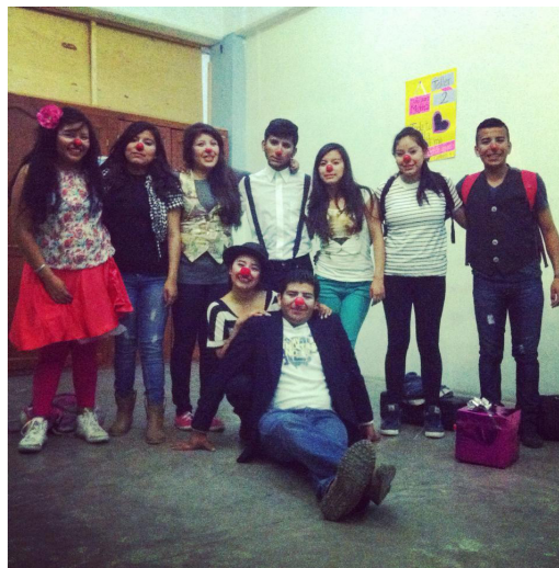
Figura 1. Grupo de Teatro TOB en una presentación de teatro callejero, 2015.

con sus hijos. Mientras que el otro 70% no dedica tiempo entre semana a este estudio. El 95% de los encuestados admite utilizar videos y películas para enseñar la doctrina filosófica cristiana. Mientras que solo el 5% utiliza material literario (Figura 1 y 2).