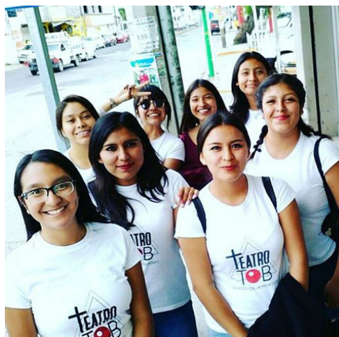
Figura 2. Grupo de Teatro TOB en una presentación como invitados en otro municipio, 2017.

Debido al confinamiento por la pandemia del virus Sars-Cov, se cancelaron todas las actividades que se realizaban en la iglesia; acción social, apoyo a adultos mayores, departamento de educación cristiana, reuniones, etc. Así que por año y medio se dejó de trabajar en el área de teatro de manera presencial pues se abrió la posibilidad de seguir ofreciendo talleres de manera virtual y lo sorprendente es que a estos talleres se sumaron docentes de educación básica que buscaban herramientas para agregar actividades lúdicas a sus clases (Figura 3).